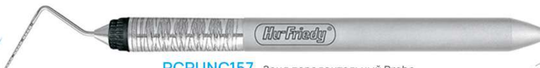
PCPUNC157 - Зонд пародонтальный Probe