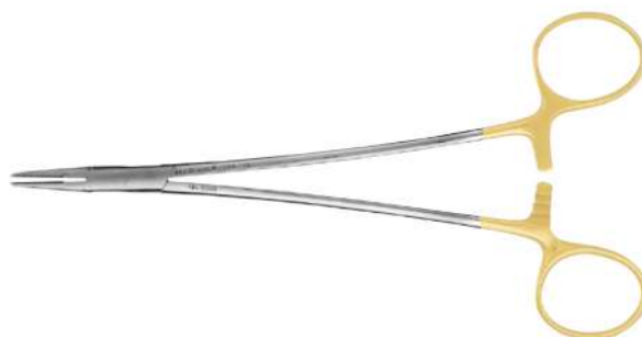
NH5046 - DeBaley с тонкими щёчками 118 см От140 до5-0