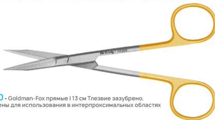
S5080 - Goldman-Fox прямые 113 см Тлезвие зазубрено. Кончики сужены для использования в интерпроксимальных областях